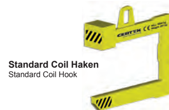
Standard Coil Haken Standard Coil Hook