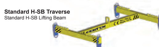
Standard H-SB Traverse Standard H-SB Lifting Beam