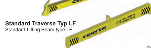
Standard Traverse Typ LF Standard Lifting Beam type LF