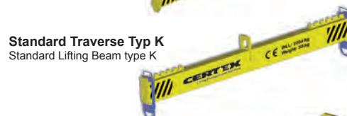
Standard Traverse Typ K Standard Lifting Beam type K