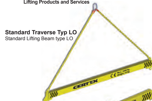
Standard Traverse Typ LO Standard Lifting Beam type LO