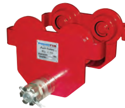
Powertex Roll- oder Haspelfahrwerke. Von 0,5 bis 20,0 t auf Anfrage.