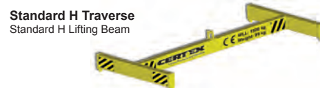
Standard H Traverse Standard H Lifting Beam