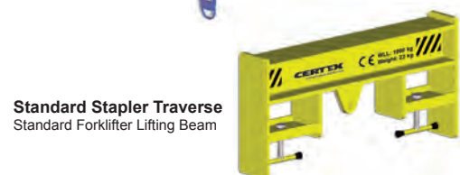
Standard Stapler Traverse Standard Forklifter Lifting Beam