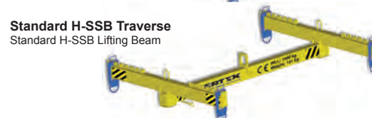
Standard H-SSB Traverse Standard H-SSB Lifting Beam

Seit mehr als 30 Jahren entwickelt, entwirft und produziert Certex ein breites Sortiment von Traversen. Auf Grund unserer langjährigen Erfahrung bieten wir nun ein komplettes Programm neu entwickelter Standard - Traversen mit kurzer Lieferzeit, funktionalem Design und Dokumentation zu einem sehr marktfähigen Preis. Sollte eine unserer Standard - Traversen nicht die optimale Wahl darstellen, bieten wir Ihnen selbstverständlich Ihre Kundenspezifische Lösung an.