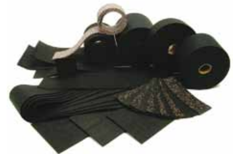
CERTEX ANTI-SLIDE MAT for use with tie downs

Anti-slide mats increase the coefficient of friction in the computation of the necessary Lashing forces. In according to VDI and other guidelines thereby the number of necessary lashing can be reduced hereby clearly.