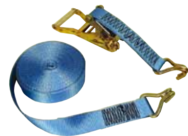
5 t tie down system with 2 double J hooks in acc. to EN 12195-2

*Other fittings and dimensions on request