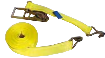
2 t tie down system with 2 double J hooks in acc. to DIN 12195-2

*Other fittings and dimensions on request.