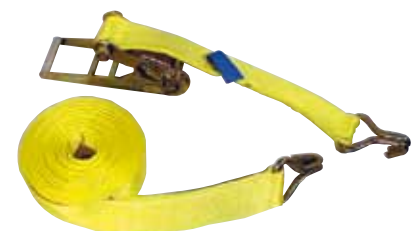
Heavy duty 10 t tie down system with 2 double J hooks in acc. to EN 12195-2

*Other fittings and dimensions on request