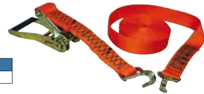
4 t tie down system with 2 double J hooks in acc. to EN 12195-2

*Other fittings and dimensions on request