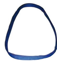
Endloshebeband 2-lagig Typ O