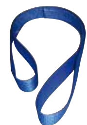
Hebeband 2-lagig mit Schlaufen Typ A