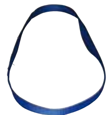
Endloshebeband 1-lagig Typ O