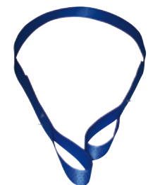
Hebeband 1-lagig mit Schlaufen Typ A